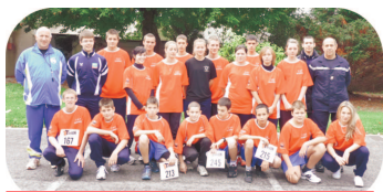
Jeunes Sapeurs Pompiers